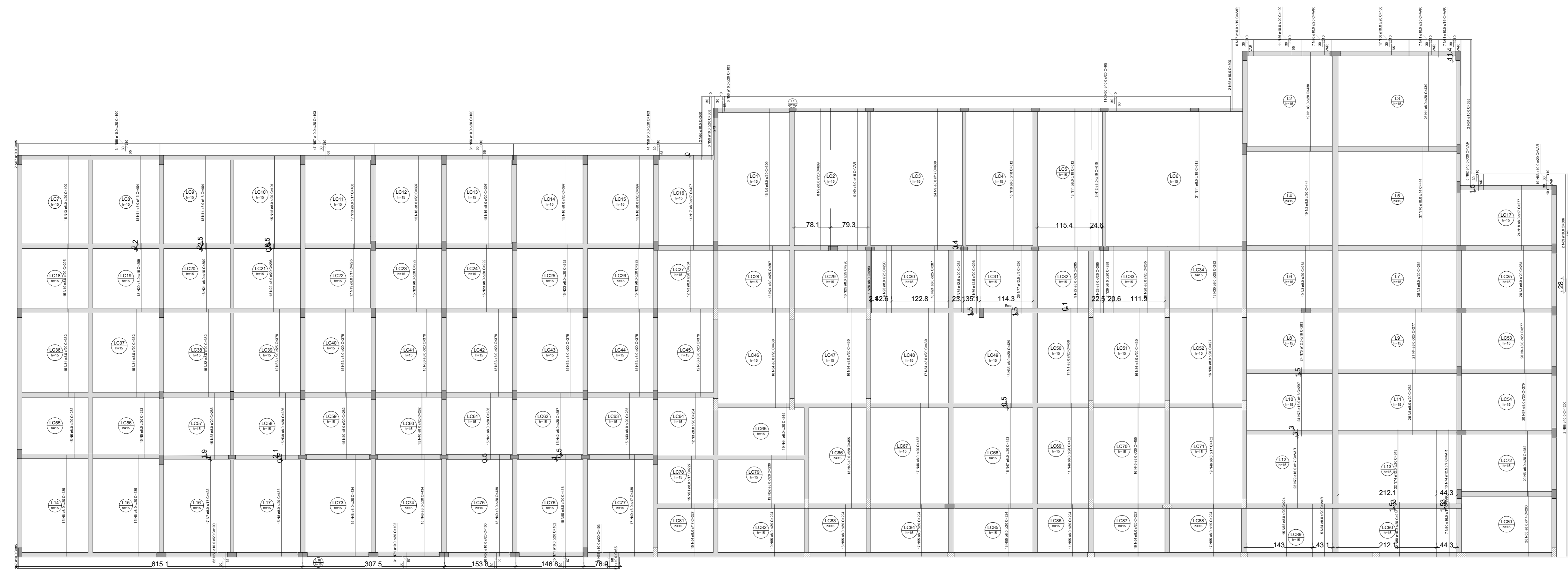
ARMAÇÃO POSITIVA DAS LAJES DO PAVIMENTO COBERTA 01 (EIXO Y)