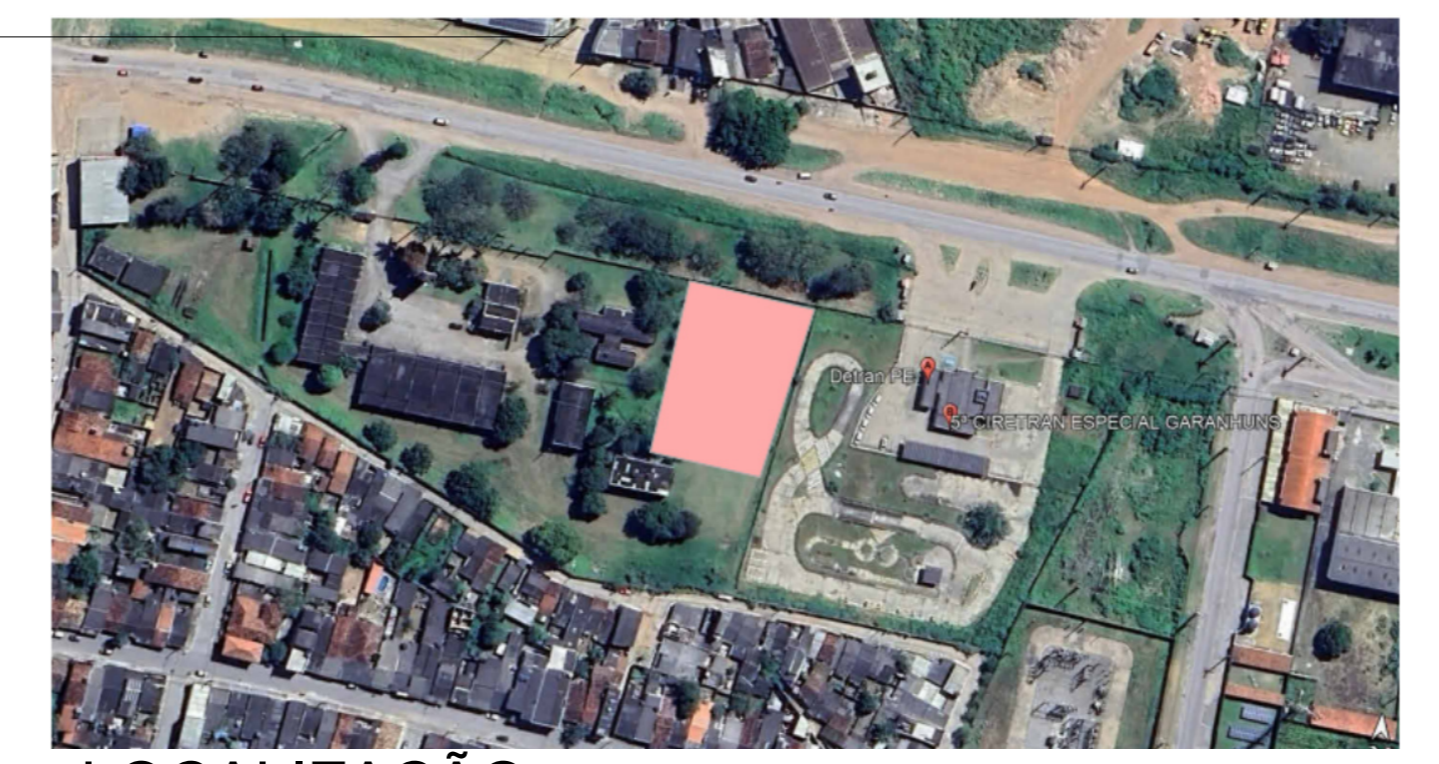
LOCALIZAÇÃO 1 : 75 OBS: ESSA PLANTA É PARA AUXILIAR NA VISITA TÉCNICA DO CMBPE, IDENTIFICANDO O TERRENO