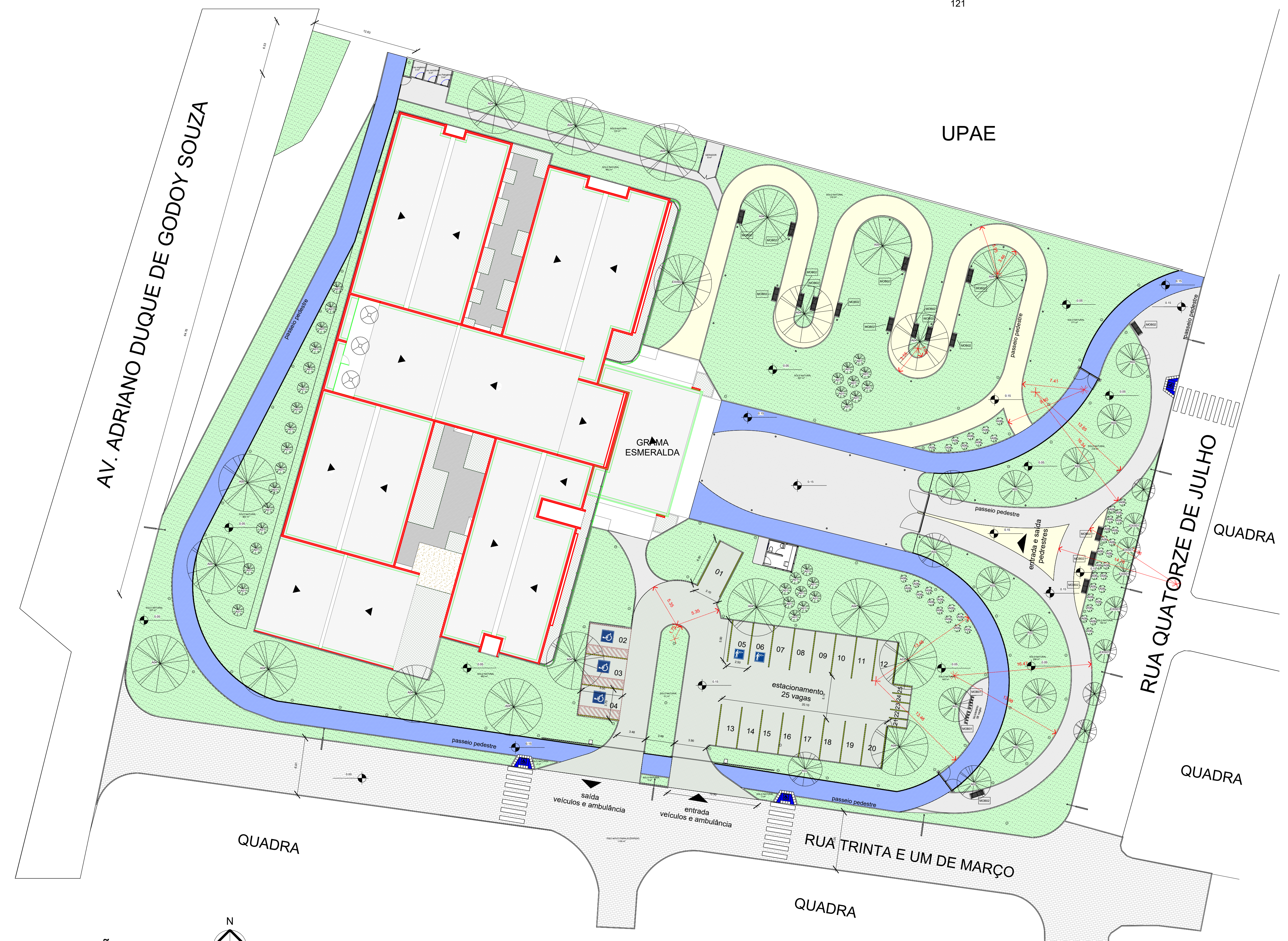
03 IMPLANTAÇÃO 1: 250