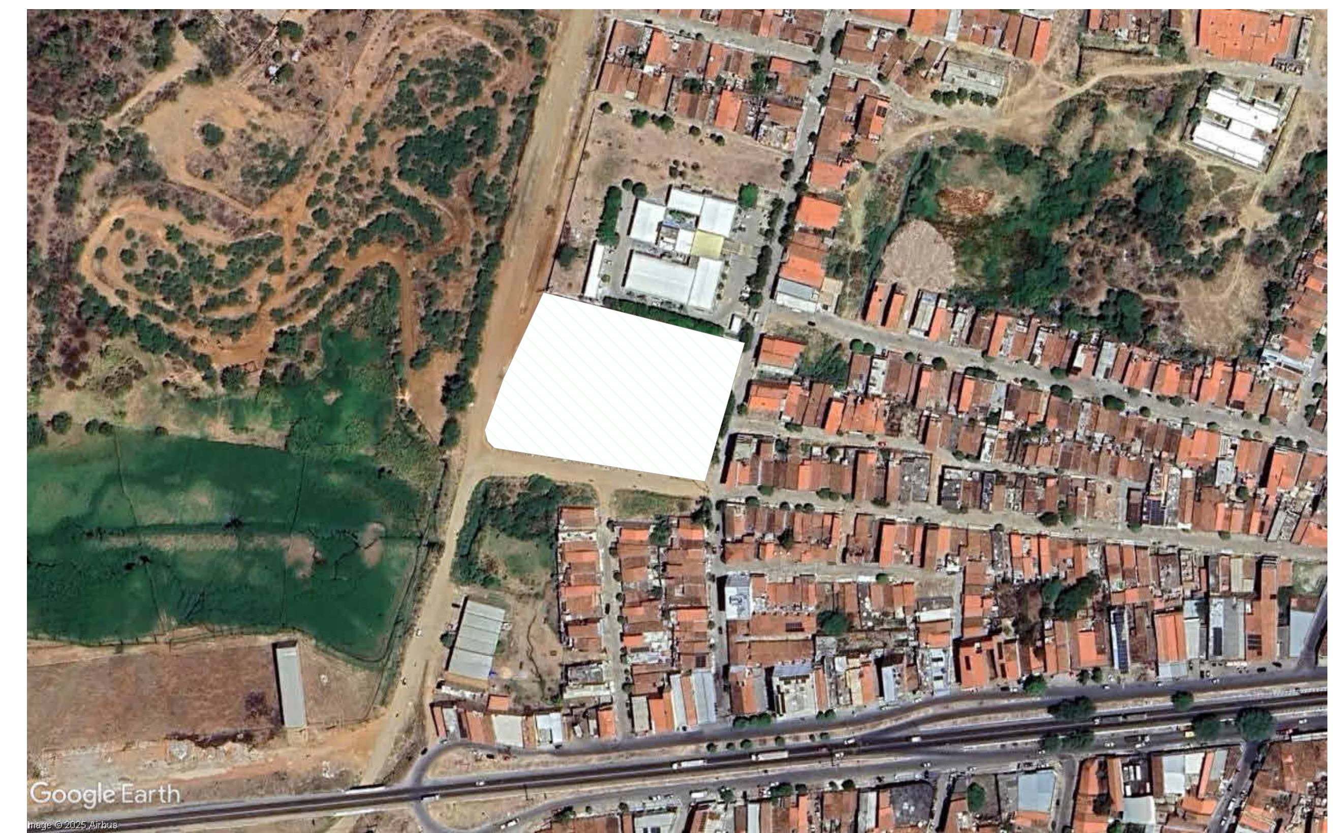
02 Localização 1: 2000