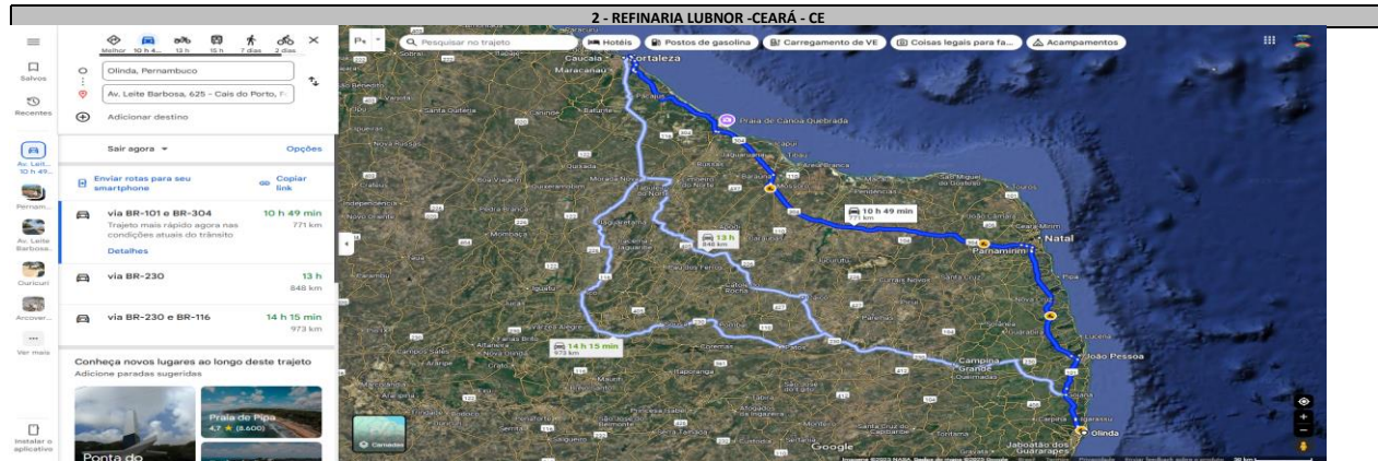
ORIGEM 2: CE- Refinaria Lubrificantes e Derivados do Nordeste, Av. Leite Barbosa, 625 - Cais do Porto, Fortaleza - CE, 60180-420