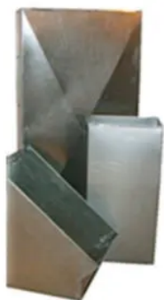
Duto Rígido Retangular/Quadrado Chapa Galvanizada (Metro)