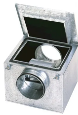
Caixa De Ventilação Para Forro Modelo: CAB-250N - 220V - SP

R$ 6.686,99 à vista com desconto PIX ou 12x de Sem juros MasterCard - Vindi