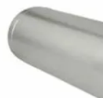
10m Duto Rígido diam. 300mm