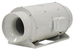
Exaustor P/Banheiro Helicocentrifugo InLine Mod: TD6000/400 S&P - 110V