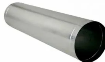
Duto Rígido Cilíndrico em Chapa Galvanizada (Metro)

R$ 5,18 à vista com desconto PIX ou 1x de R$ 5,58 (com desconto) Sem juros MasterCard - Vindi