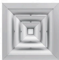
Difusor De Ar 4 Vias Em Alumínio + Caixa Plenum - 4 - 310 X 310 Mm - + Cx. Pl. 10" - Natural