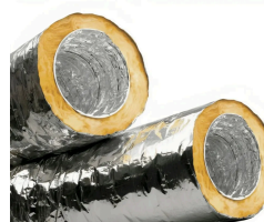
Duto Flexível Aluminizado Isolado (RI. C/6 Mts) - 3 Pol. - 86 Mm

R$ 567,00 à vista com desconto PIX ou 12x de 52.5 Sem juros MasterCard - Vindi