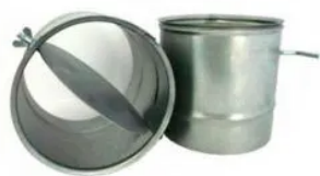
Colarinho para Duto Flexível c/Registro