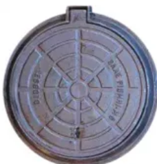
Tampão T60 Articulado Pesado (58 cm) Em Ferro Fundido