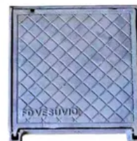
Tampão Articulado (60x60 Cm) Em Ferro Fundido