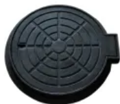
Tampão T60 Articulado Leve (58 cm) Em Ferro Fundido