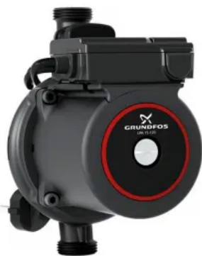
Bomba Pressurizador Grundfos Upa 120 Monofásica 220v