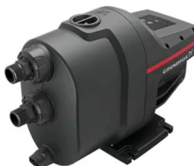
Pressurizador Grundfos Scala1 600W 0,56CV 5-25 230V até 5 banheiros