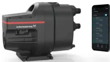
Pressurizador Grundfos Scala1 3-45 900w 0.76cv Monofásico 220v - Até 4 Banheiros