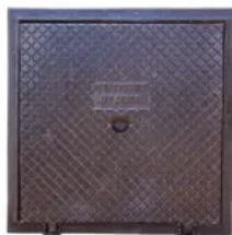
Tampão Articulado (60x60 Cm) CL125 Em Ferro Fundido Nodular