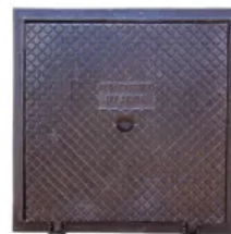
Tampão Articulado (40x40 Cm) CL125 Em Ferro Fundido Nodular