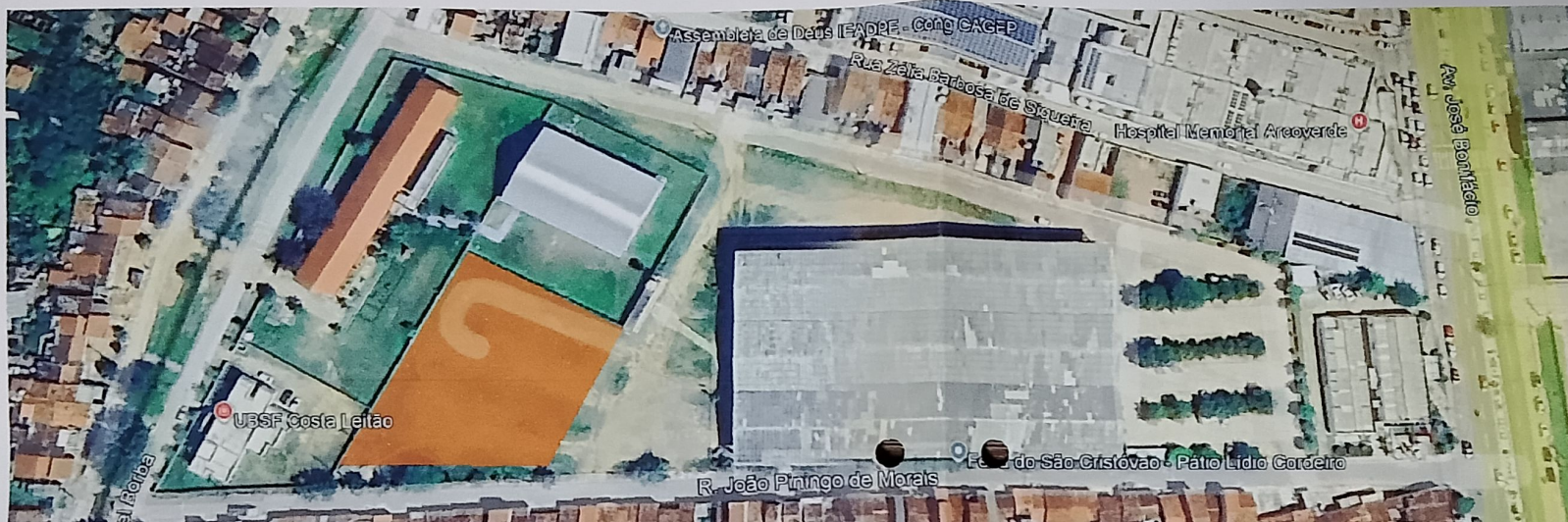
1 PLANTA DE SITUAÇÃO SATELITE ESCALA GRÁFICA