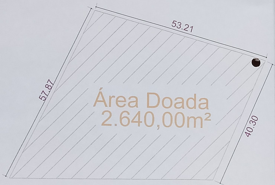
1 SITUAÇÃO DOADA 260.93 ESCALA GRÁFICA