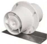
Exaustor para Banheiro Mod: Inline-270 Bivolt

R$ 202,50 à vista com desconto PIX ou 7x de R$ 32,14 Sem juros MasterCard - Vindi