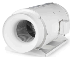
Exaustor P/Banheiro Helicocentrífugo InLine Mod: TD2000/315 Silent S&P - 220V