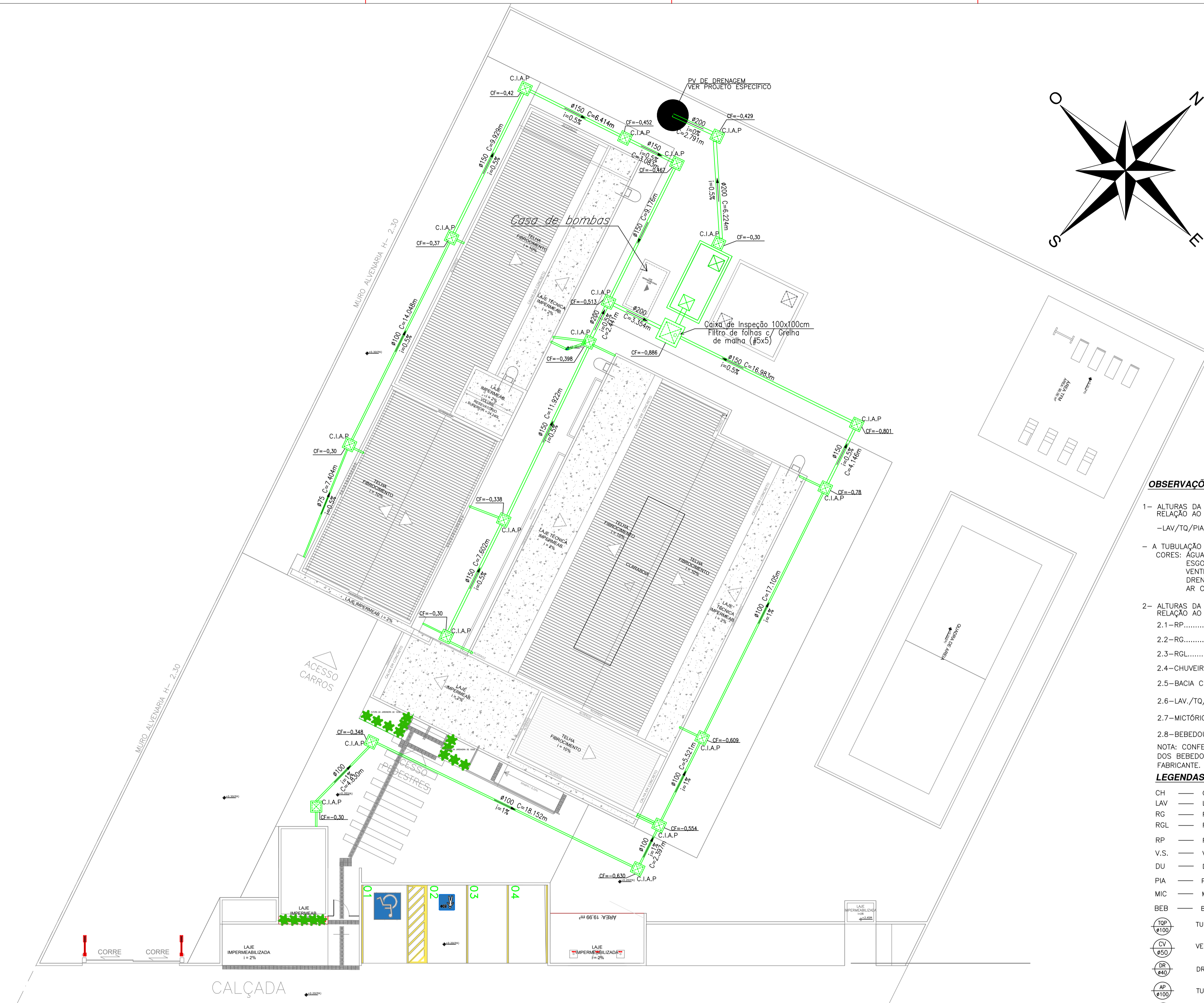
PLANTA BAIXA - IMPLANTAÇÃO BOMBEIRO MILITAR SEÇÕES ESCALA 1/150