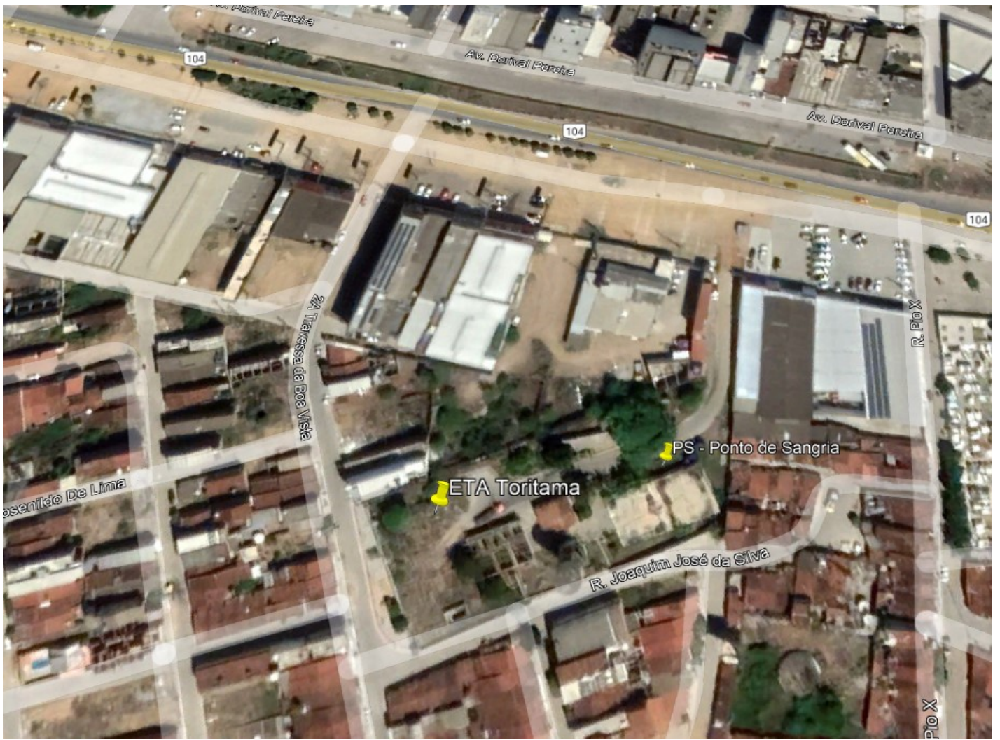
FIGURA 1 - LOCAL DA INTERLIGAÇÃO