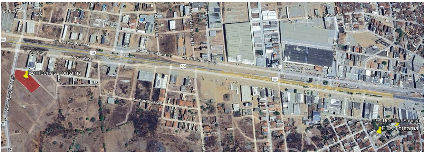
FIGURA 2 - LOCAL DA INTERLIGAÇÃO EM RELAÇÃO AO EMPREENDIMENTO