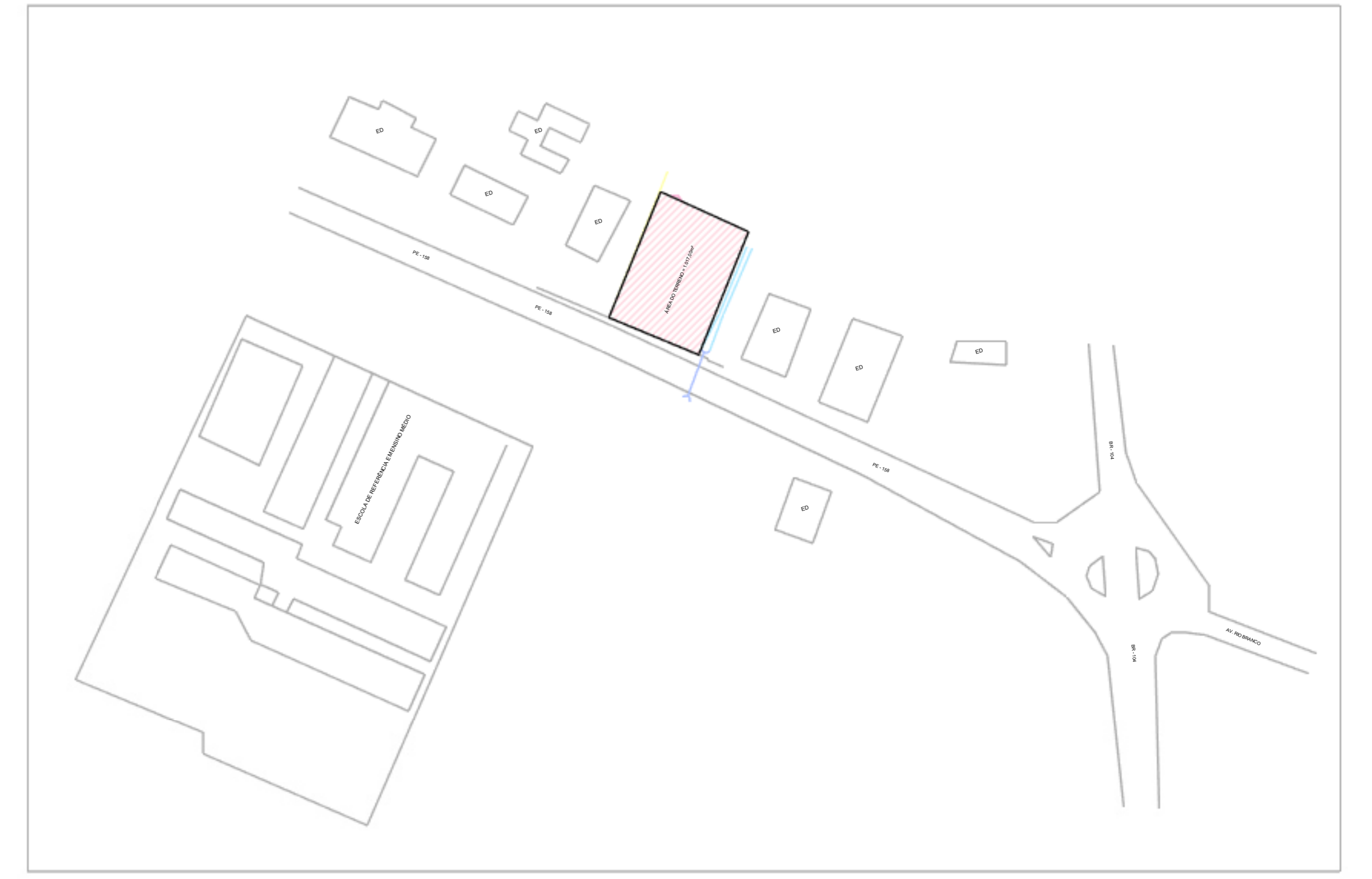
2 Planta Situação 1 : 1250