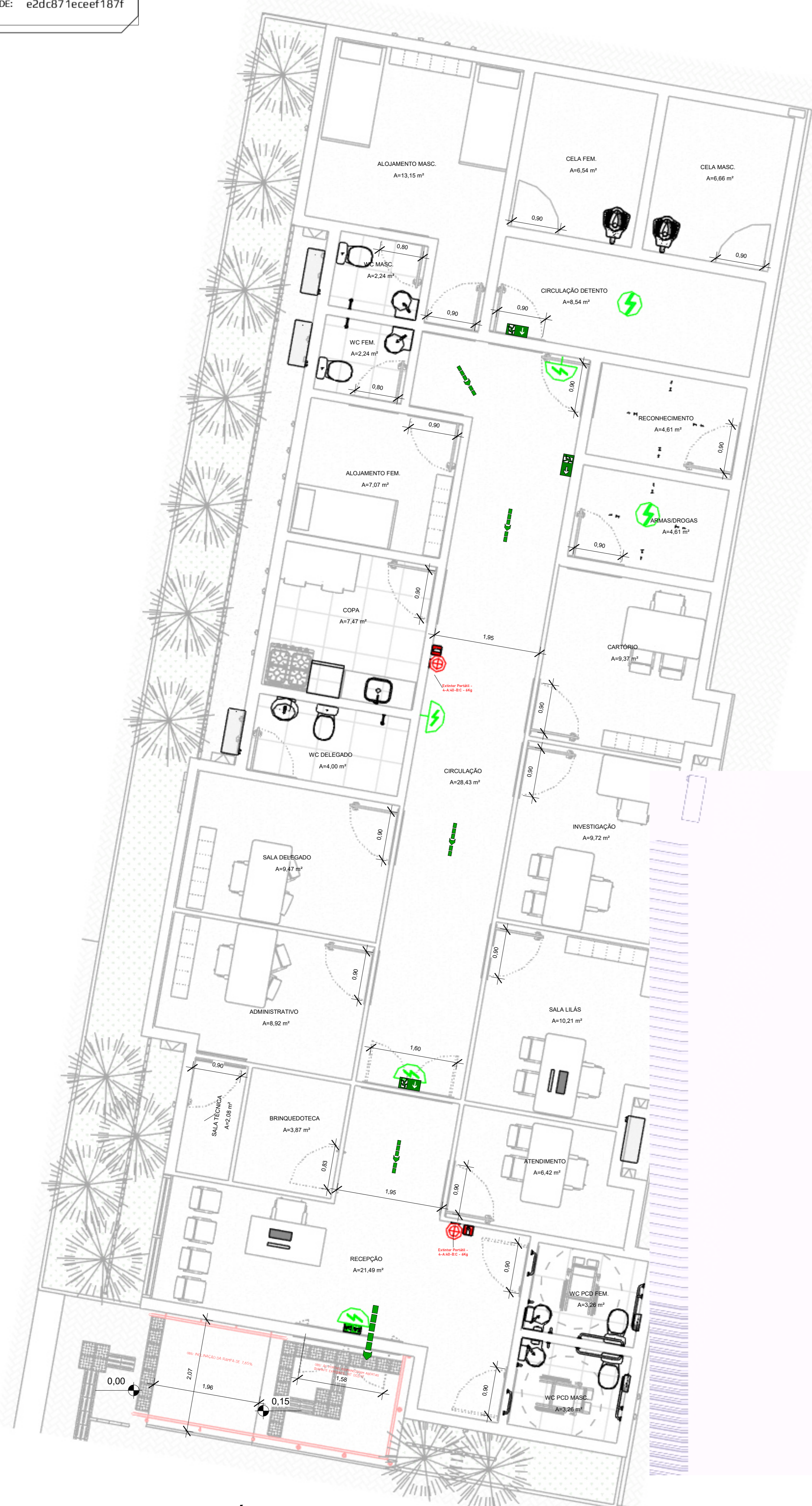
1 PLANTA BAIXA TÉRREO 1 : 50