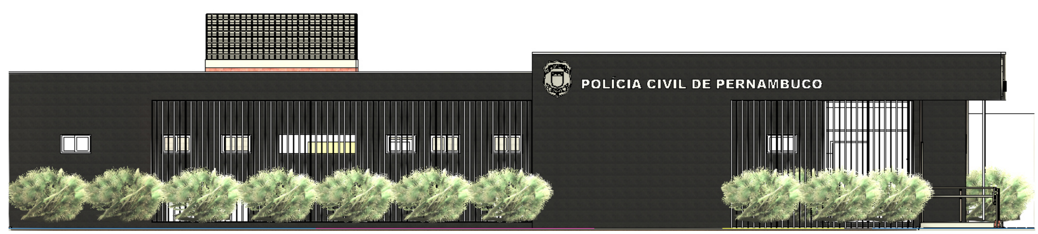
5 FACHADA LATERAL 1 : 50