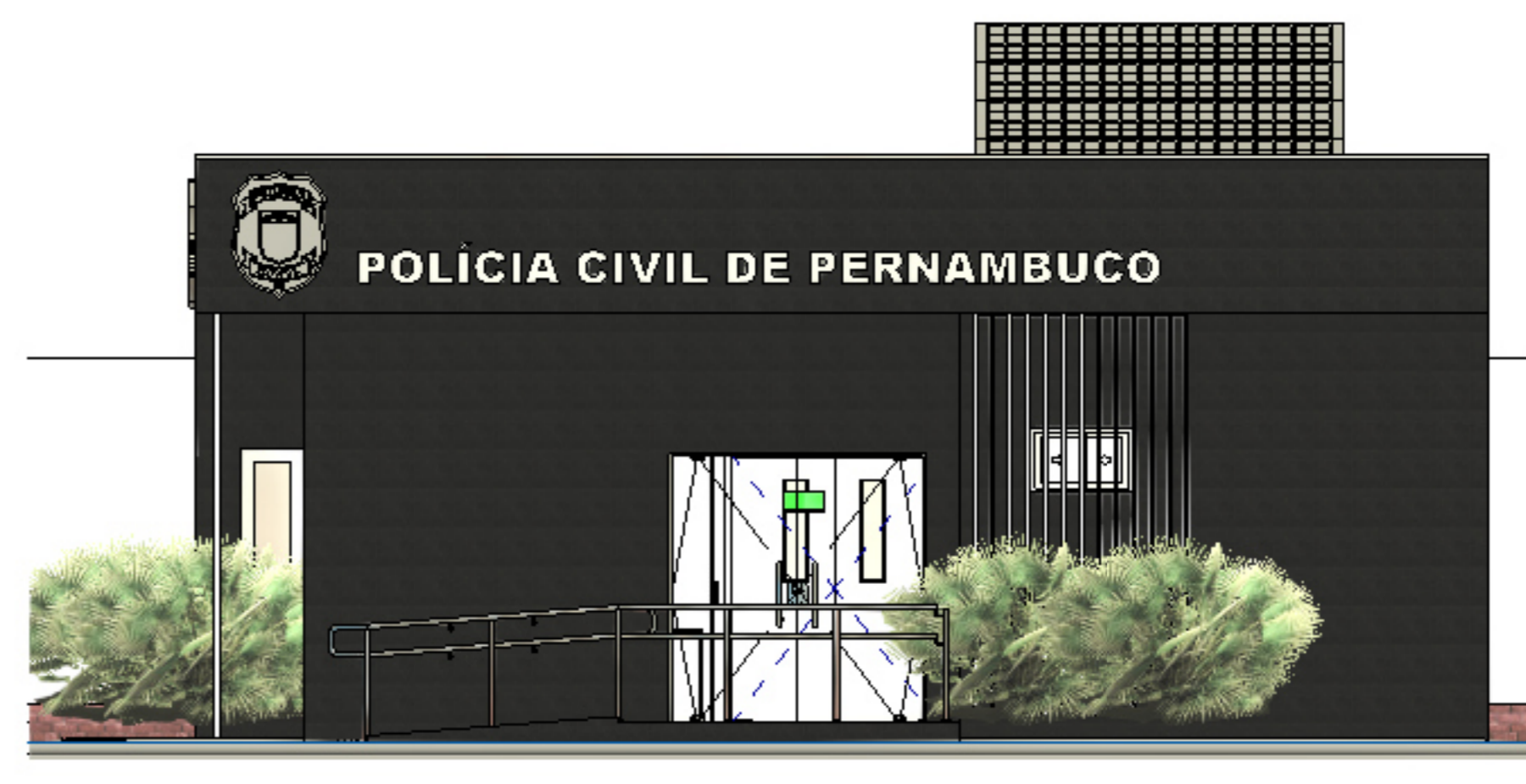
4 FACHADA FRONTAL 1 : 50