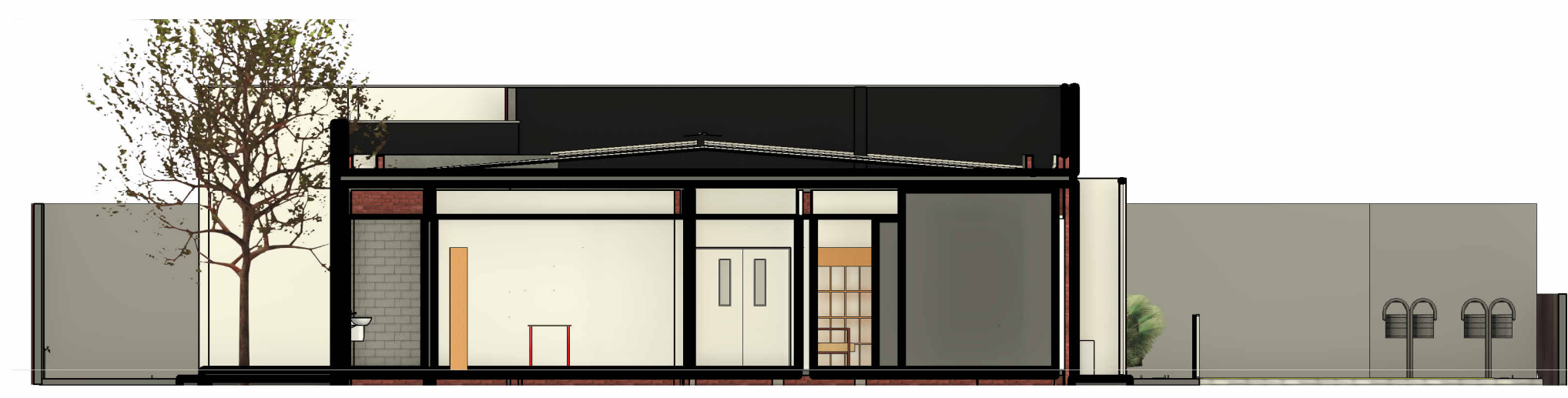
4 Corte 2 1 : 100