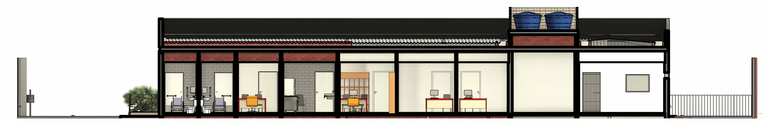
3 Corte 3 1 : 100