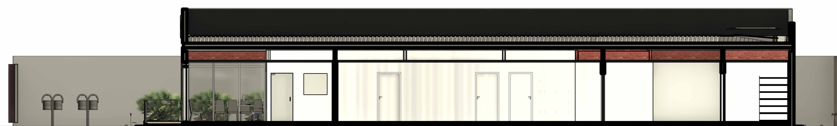
4 Corte BB 1 : 100