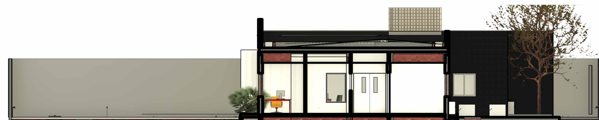
3 Corte AA 1 : 100