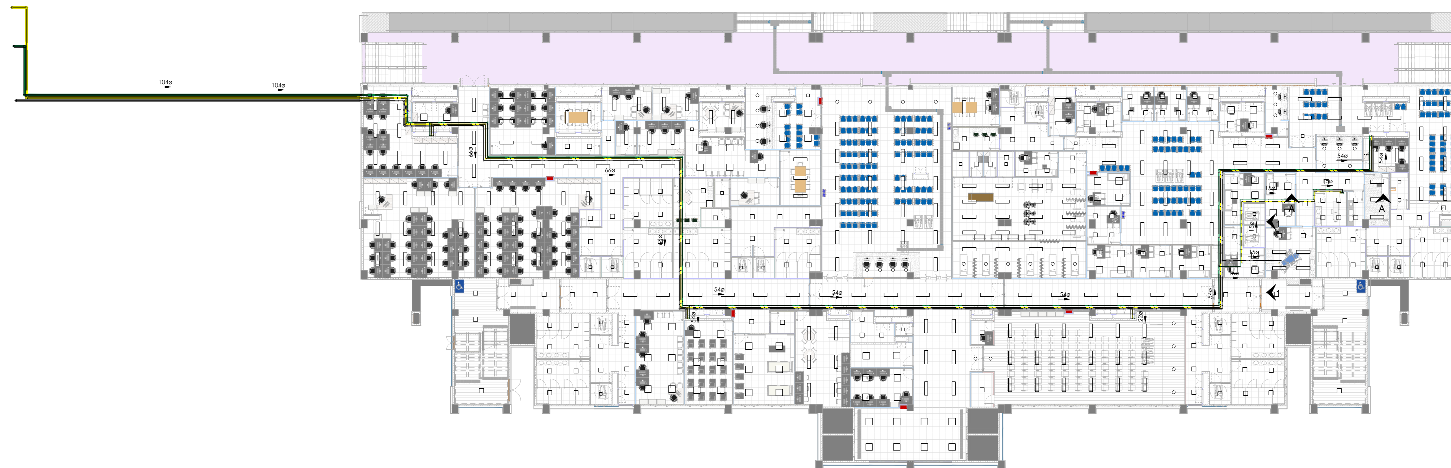
Planta baixa - Térreo, Tubulações 1 : 200