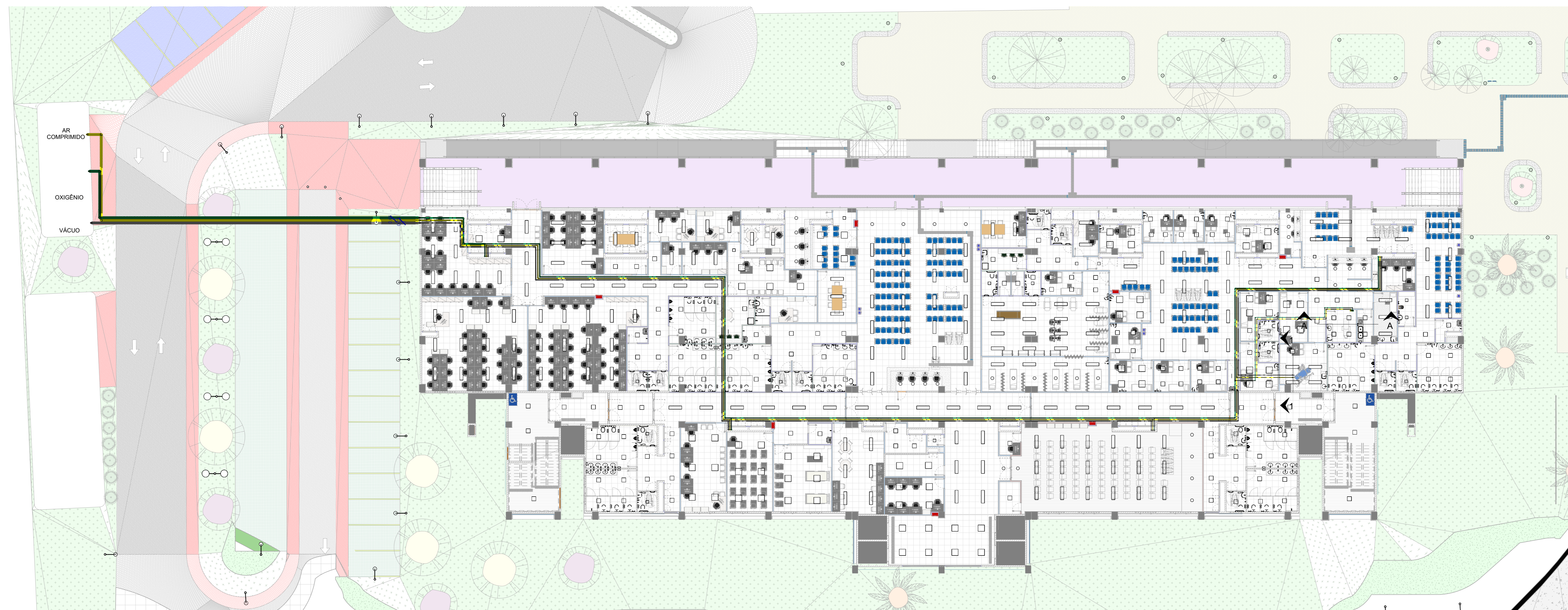
Planta Baixa - Térreo 1 : 200