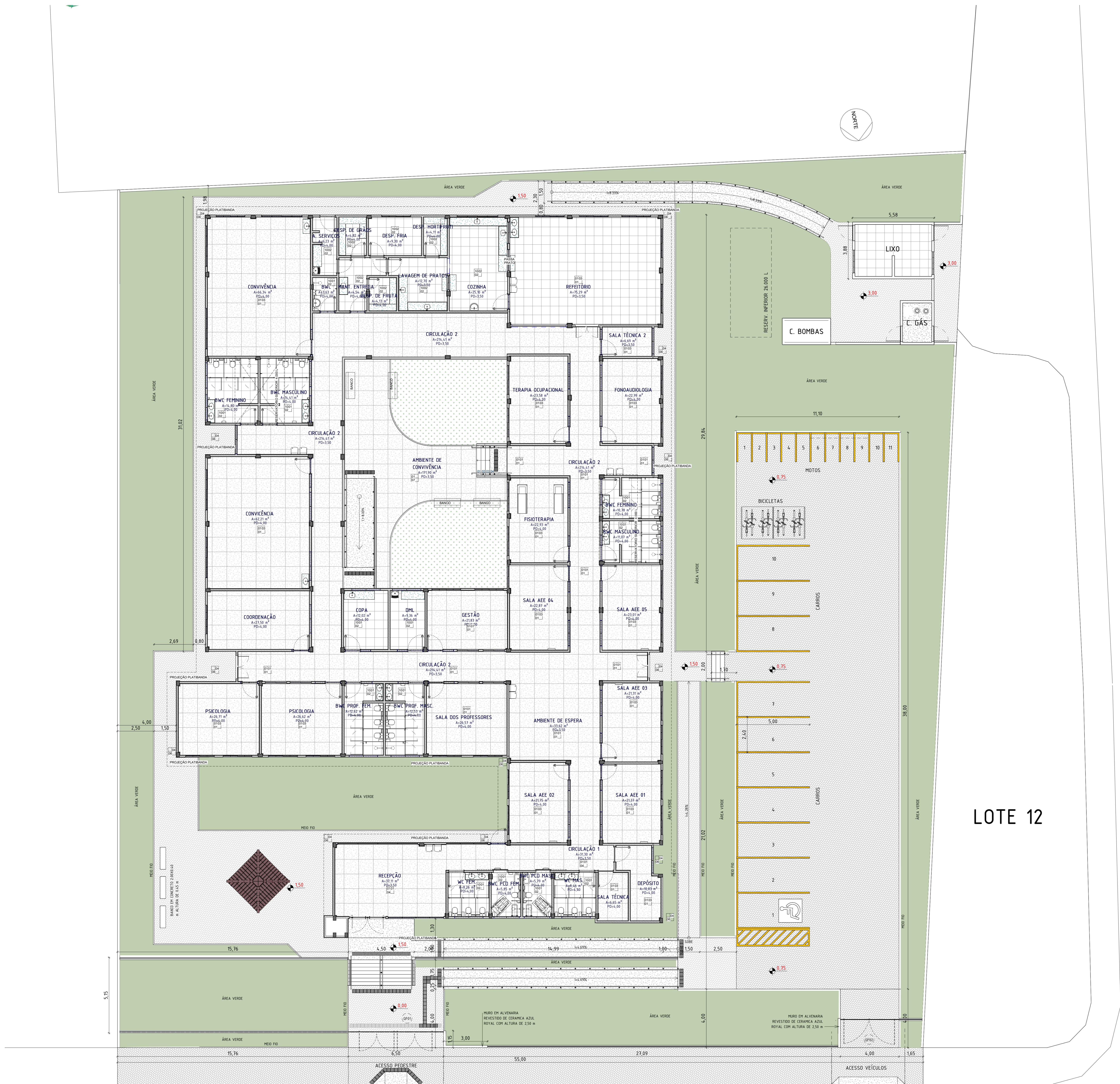
1 IMPLANTAÇÃO (PLANTA BAIXA) 1 : 100