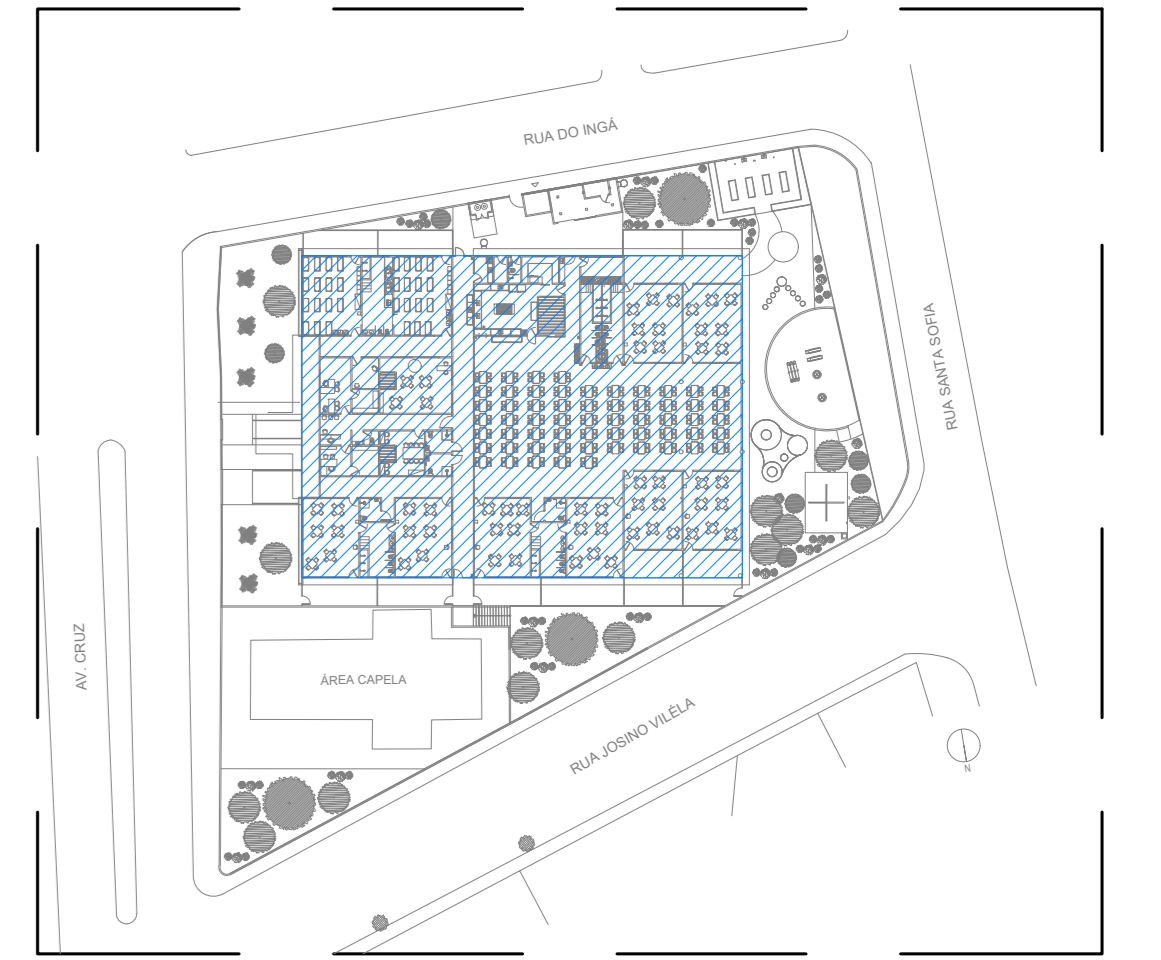
ENERGIA COMERCIAL - ILUMINAÇÃO 02 PLANTA BAIXA DE LOCAÇÃO ESCALA: 1:750