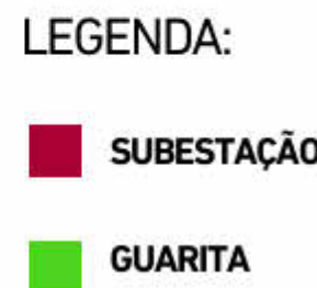
1 : 2000

REMOÇÃO DE PINTURA ATUAL E EXECUÇÃO DE PINTURA ACRÍLICA EMBORRACHADA EM PAREDES, 2 (duas) DEMÃOS, ACABAMENTO FOSCO, COR BRANCO GELO, COM SELADOR ACRÍLICO E COM EMASSAMENTO EM MASSA CORRIDA ACRÍLICA