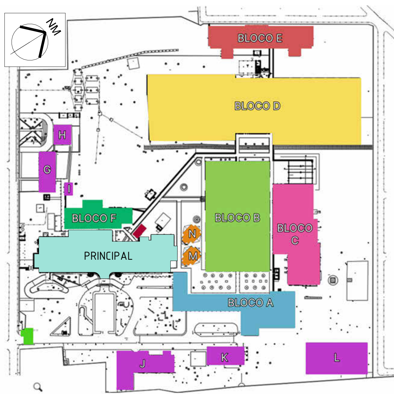
1 MAPA - PLANTA CHAVE 1 : 2000