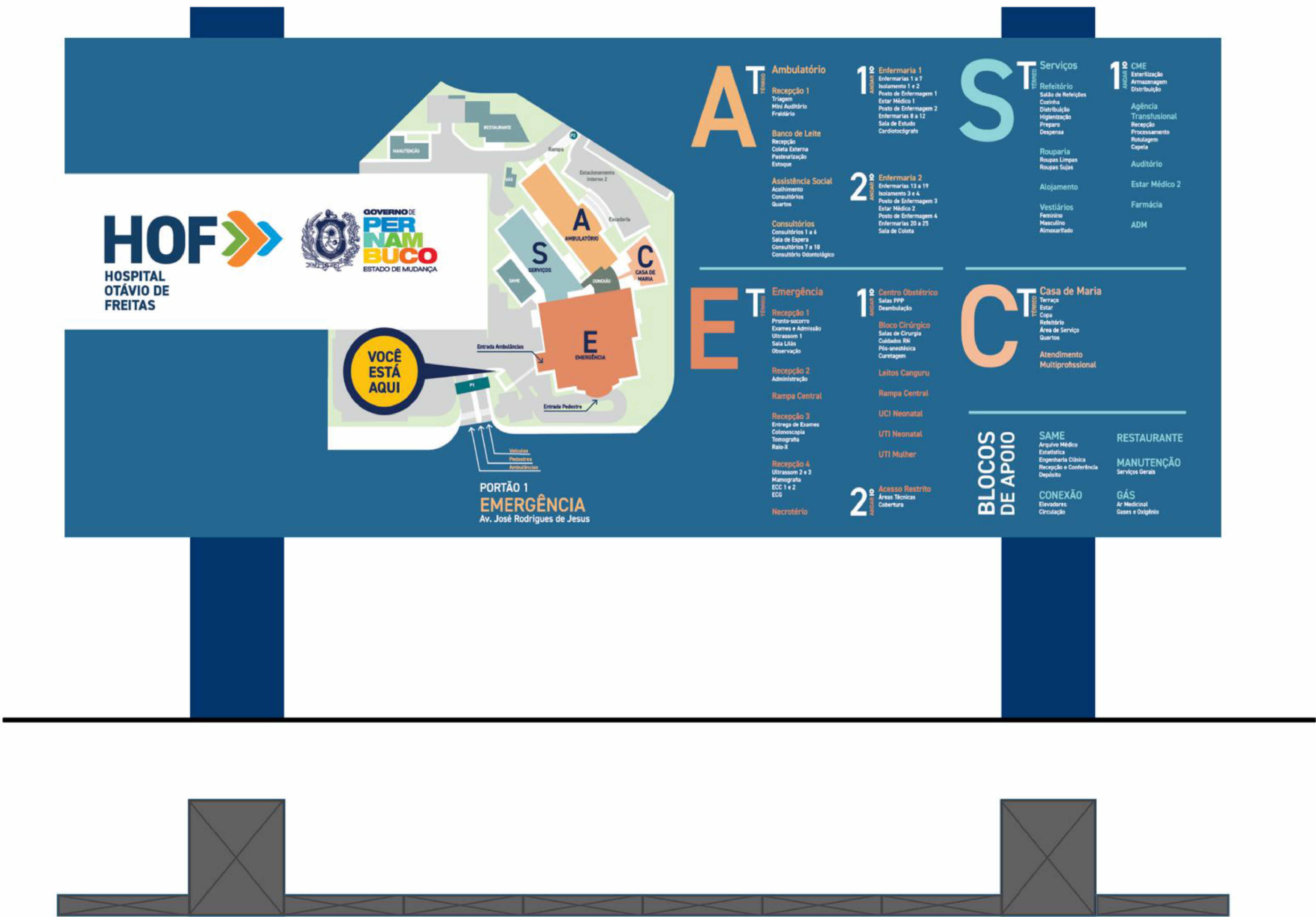
ESQUEMA ELEVÇÃO COM O MAPA IMPRESSO EM ADESIVO UV

OBSERVAÇÕES GERAIS: 1) TODAS AS EMPRESAS CONTRATADAS PARA A PRESTAÇÃO DE SERVIÇOS REFERENTES À REFORMA, A EXEMPLO DAS ESQUADRIAS E TELHADOS (ENTRE OUTROS), DEVERÃO CONFERIR AS MEDIDAS NO LOCAL; 2) QUALQUER DISCREPÂNCIA ENTRE O PROJETO E A OBRA DEVERÁ SER COMUNICADA AO ARQUITETO RESPONSÁVEL, PARA QUE O MESMO POSSA FORNECER A SOLUÇÃO ADEQUADA; 3) PARA MELHOR COMPREENSÃO DOS DESENHOS, O PROJETO DE ARQUITETURA DEVERÁ SER PLOTADO COLORIDO; 4) MANTER INCLINAÇÃO DO TELHADO EXISTENTE; 5) OS MATERIAIS DE REVESTIMENTOS EXTERNOS ESTÃO PREVISTOS NAS PLANTAS; 6) VER DETALHES EXECUTIVOS NAS PLANTAS DE "DETALHES SINALIZAÇÃO" Nº 10/10;