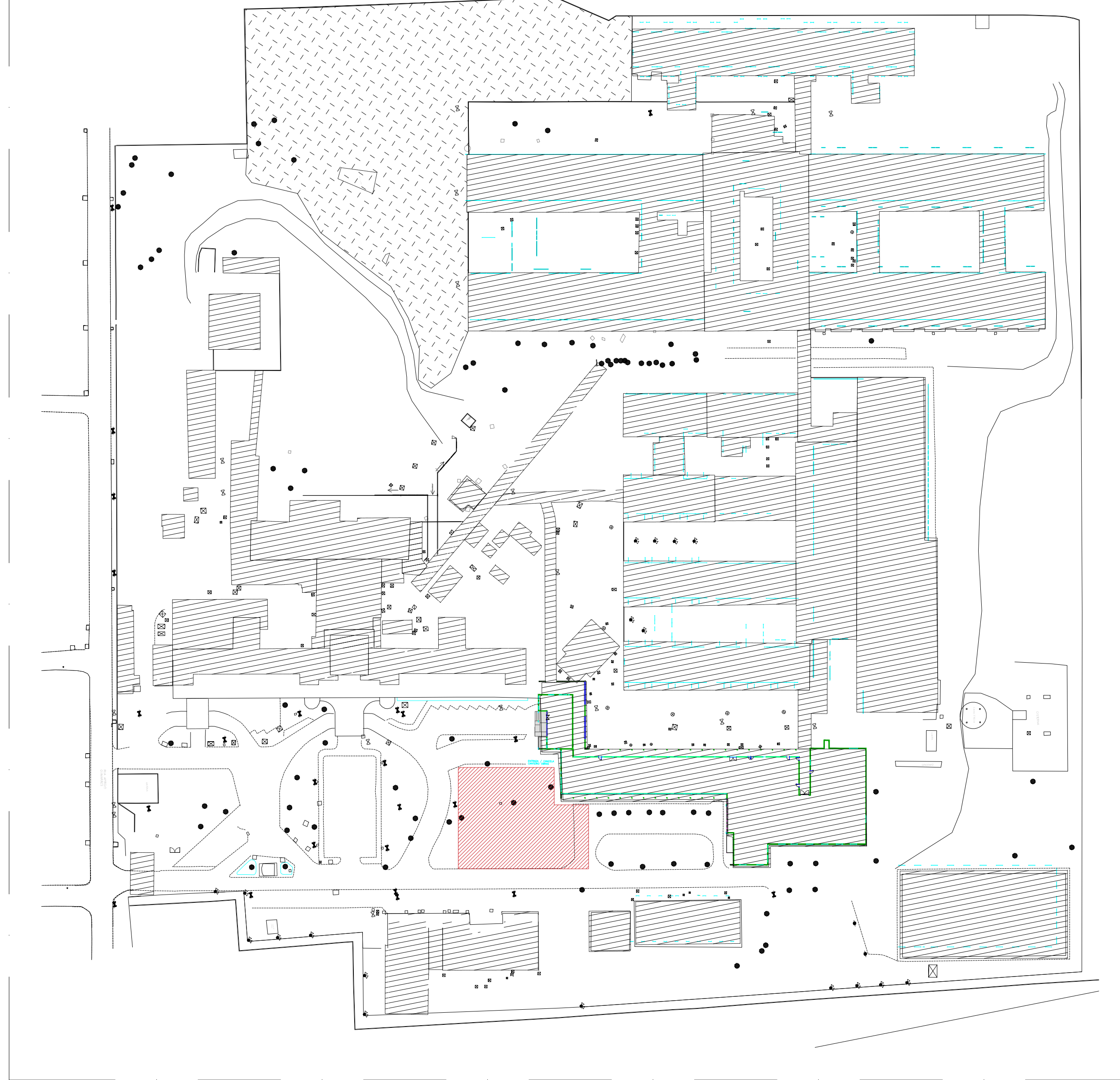
1 IMPLANTAÇÃO GERAL 1 : 1000